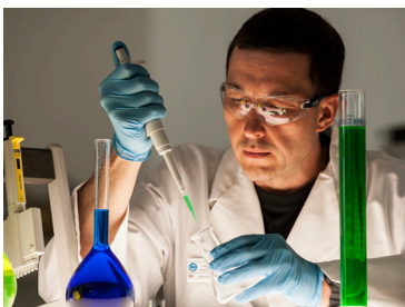
Le responsable de la qualité de l'eau