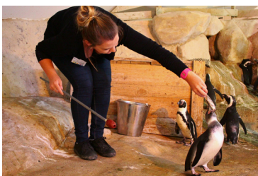
Le métier de soigneur