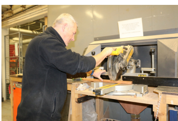
L'atelier, le métier de menuisier-peintre

Dans le cadre du Parcours Avenir, NAUSICAA vous propose l'animation "Les métiers de NAUSICAA" !