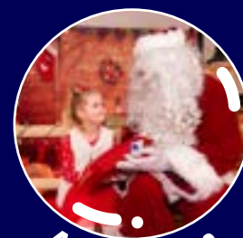
Animation Père Noël